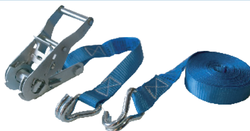
Art. 187 FASTY SPÄNNBAND

1 st ändlös, B=25 mm, L=500 cm, 1000 kg. Blå