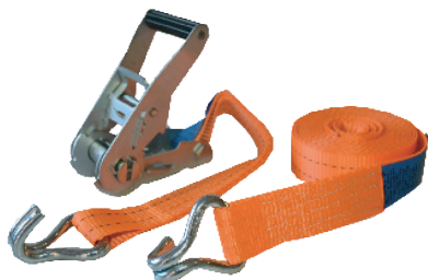
Art. 188 FASTY SPÄNNBAND

1 st med krokar, B=25 mm, 2-delad (L=30 cm + 470 cm), 1000 kg. Blå