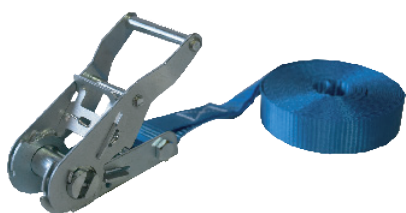
Art. 186 FASTY SPÄNNBAND

1 st med krokar, B=25 mm, 2-delad (L=30 + 470 cm), 800 kg. Svart