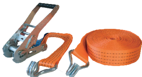
Art. 192 FASTY SPÄNNBAND

1 st med krokar, B= 50 mm, 2-delad (L=50 cm + 950 cm), 4000 kg. Orange