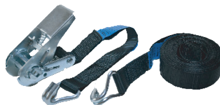
Art. 182 FASTY SPÄNNBAND

1 st ändlös, B=25 mm, L=500 cm, 800 kg. Svart