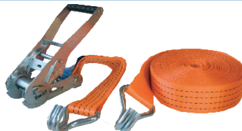
Art. 189 FASTY SPÄNNBAND

1 st med krokar, B=35 mm, 2-delad (L=50 cm + 450 cm), 2500 kg. Orange