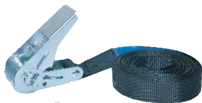
Art. 180 FASTY SPÄNNBAND

1 st ändlös, B=25 mm, L=500 cm, 800 kg. Svart